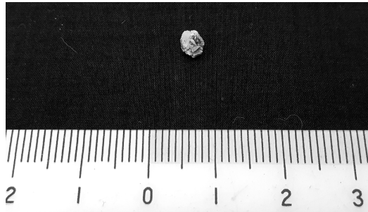
結石の大きさはさまざま。脂肪肝、内臓脂肪、結石の確認のためには早めに検査を

小さな尿管結石に対しては、レーザーによる経尿道的手術が行われます。尿管や腎盂内の結石をレーザーで砕き、この場合はほとんどの破砕片を内視鏡で確認して取り除きます。時間はかかりませんが、確実に結石を取り除くことができる治療法です。今はレーザーの碎石力